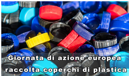
Giornata di azione europea raccolta coperchi di plastica

Un interessante legame tra le due date solo se si pensa che proprio la plastica è tra i maggiori materiali/ rifiuti che inquinano il pianeta e quindi occorre prestare molta attenzione nel loro uso, smaltimento e riciclo.